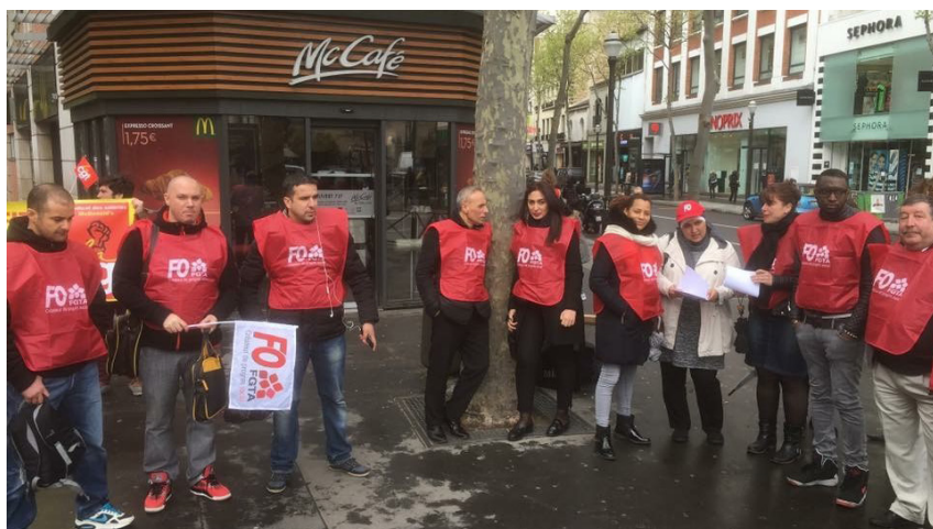
Mobilisation de FO-McDonald's demandant des explications à l'enseigne concernant l'évasion fiscale le 25 novembre 2016.

Le groupe américain McDonald's multiplierait les manœuvres pour s'enrichir toujours plus au détriment de ses travailleurs, de ses consommateurs et maintenant de ses franchisés comme le révèle l'EFFAT (Fédération Européenne des Syndicats de l'Alimentation, de l'Agriculture et du Tourisme) et le syndicat américain SEIU dans leur rapport McProprio de mars 2017.